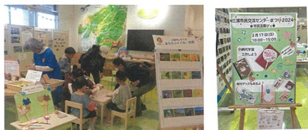
小網代の森インフォメーションスペース