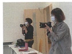
ニナイトカレッジ デジタル時代の写真の楽しみ方