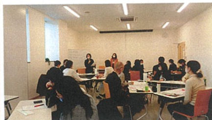
市民活動マッチングイベント

2023年5月8日からは利用制限がなくなりました。本格的に活動をスタート、または再開する皆さんの活動をお待ちしています。これからもニナイトをよろしくお祈いします。