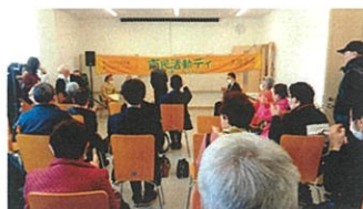
市民交流センターまつり・市民活動デイ